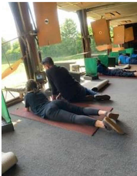
Jungschützenkurs mit Schutzkonzept

Die Planung war nicht einfach, da wir ja an ein Schutzkonzept gebunden waren. Daher haben die ersten zwei Kurstage nach dem Restart auch an Samstagen stattgefunden. Dadurch konnten wir gewährleisten, dass sich nicht zu viele Schützen im Schiessstand aufhielten. Hier ein herzliches Dankeschön allen Helfern, die mich stets tatkräftig unterstützt haben!